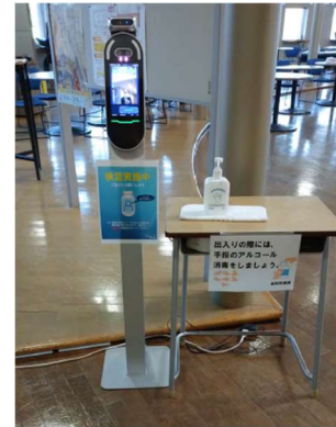
各建物入口に消毒液・検温器を設置