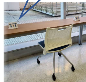
教室、PC室、自習室等では、座席間隔を空けて着席するよう入口や室内に案内を掲示